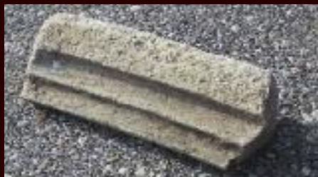
Gotische Kreuzrippe aus der beim Erdbeben von 1590 zerstörten Kirche von Abstetten.

Von trauriger Aktualität - man denke nur an Japan - sind die zerstörerischen Kräfte der Erde: in NÖ ist zum Beispiel das verheerenden Erdbeben von 1590 in den historischen Quellen bestens bezeugt.