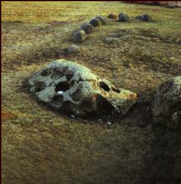
Der „Heilige Stein“ bei Mitterretzbach