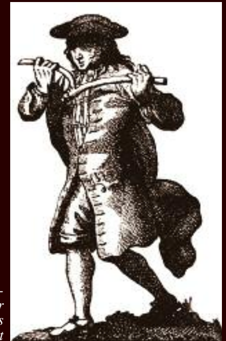
Wünschelrutengänger nach Pater Lebrun, spätes 17. Jahrhundert