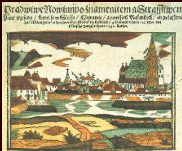
Auswirkungen des Erdbebens von 1590 in Wien, dargestellt auf einer zeitgenössischen Flugschrift (kolorierter Holzschnitt) Olomouc 1590.

NÖ Museum für Volkskultur Groß-Schweinbarth Tel. 02289/2687 und 02289/2302 (Gemeindeamt)