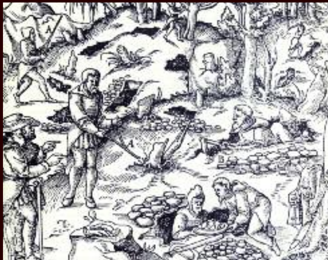
Aufsuchen von Erzadern mit Wünschelrute. Holzschnitt aus Georg Agricola, „Vom Berg- und Hüttenwesen“ 1557

Wünschelrutengänger standen auch im Auftrag des Militärs an den Fronten des I. Weltkrieges. So auch der k. u. k. Oberst Beichl, dem Kaiser Franz-Joseph für seine „Mutungen“ die „goldene Wünschelrute“ verlieh und Major Musil, der u. a. Erdölvorkommen bei Zistersdorf entdeckte.