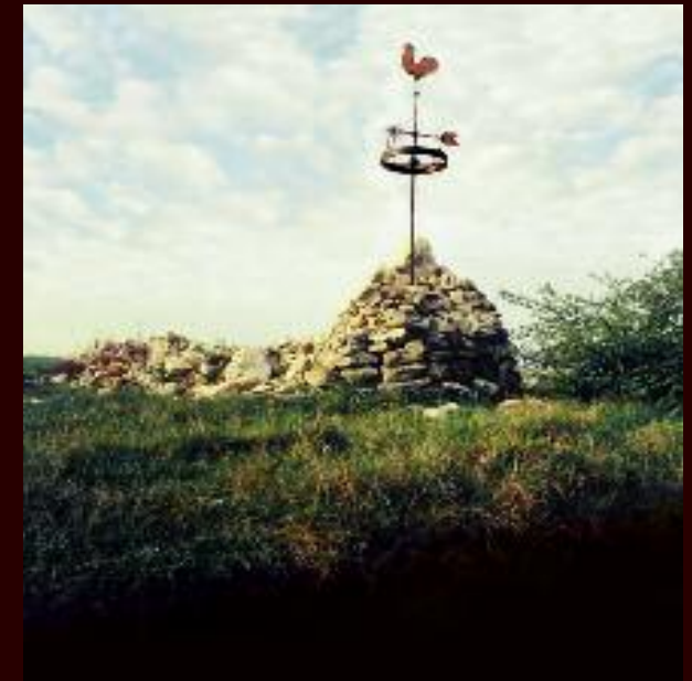
Steinhaufen am Scheideweg bei Ulrichskirchen

Viele Bildstöcke sind Denk-Mäler der Erinnerung: an Türken-, Schweden-, oder Franzosenkriege an einen Unfall oder Mord „bei dem einer vom Leben zum Tod befördert wurde“, oder an Cholera und Pest und oft markieren sie einen „Ort der Kraft“.